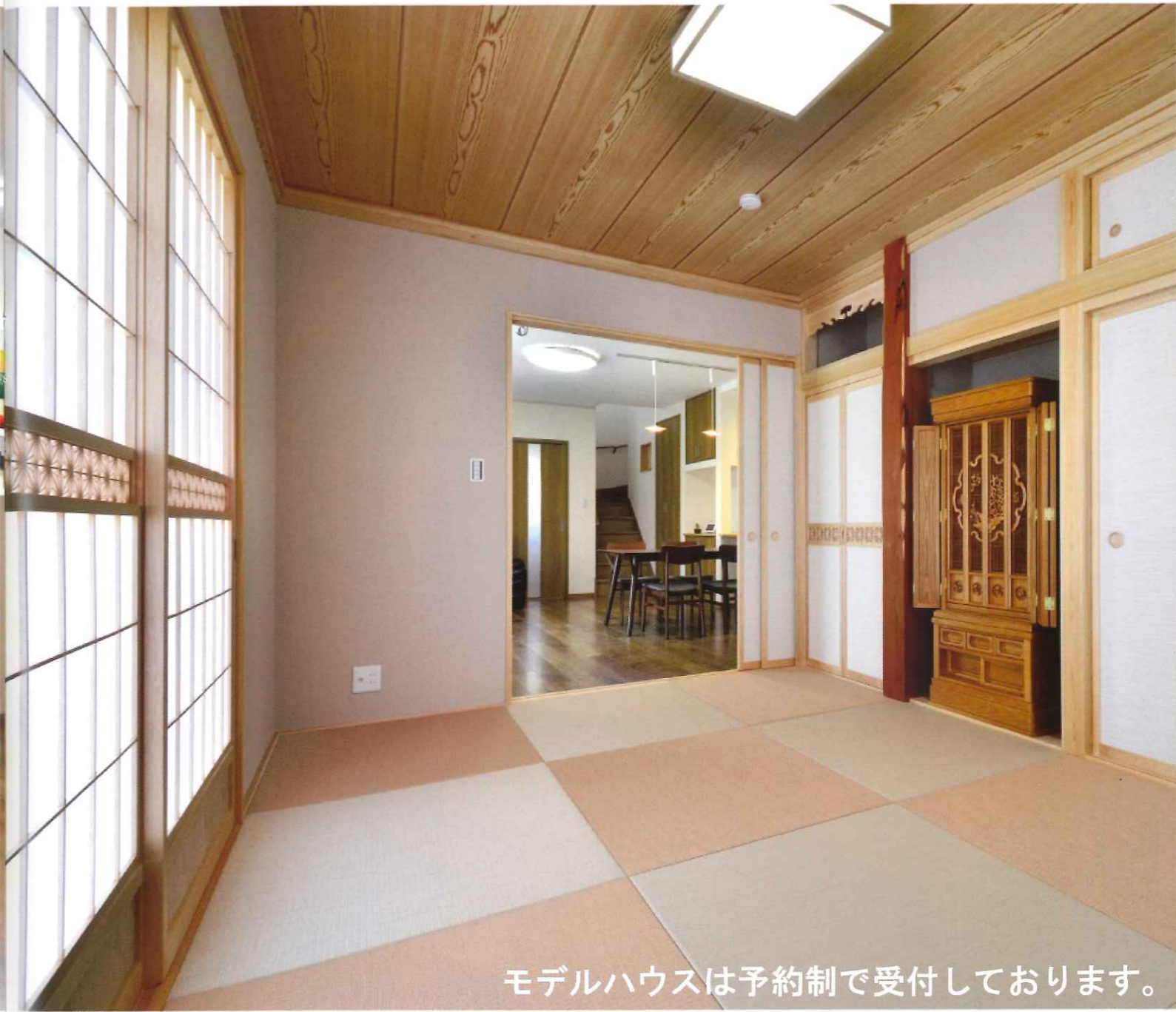
モデルハウスは予約制で受付しております。